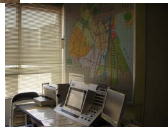
↑品川区 防災行政無線室