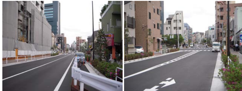
補助 163 号線（大井 1 ~ 2 丁目）※旧 一本橋通り

先月、やっと補助 163 号線（旧一本橋通り）リニューアルし開通しました。この間、特に沿道にお住まいの方やご商売をされている方など、大変にご迷惑をおかけいたしました。多大なるご理解・ご協力を頂き本当に有難うございました。