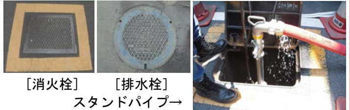
[消火栓] [排水栓] スタンドパイプ

災害支援ボランティアとは、消防団OBや消防少年団の経験者、また応急救護のできる方などが、地震などの自然災害や事故などが発生した場合、消防隊を支援するボランティアのことですが、今回、初めて消防団と合同で初期消火訓練を行いました。初期消火には、消火器の他に軽可搬消防ポンプのスタンドパイプがあり、火災時の水源として道路や歩道に設置されている消火栓・排水栓を使用して消火します。※現在、区では各町会にスタンドパイプの配備を進めています。