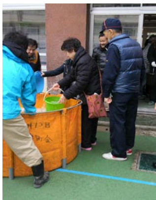
プールの水を生活用水に使用→

合わせて、区内23カ所の避難所運営訓練が同時に行われ、私は避難所（山中小学校）に参加しました。ここでは、トイレの水が断水した場合を想定して、プールの水を使用。D級ポンプで汲み上げたプールの水は、バケツ2～3杯の水で流す訓練を実施しました。