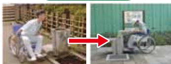
ステップ付は車椅子で利用できない