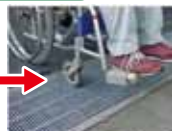
横断側溝（細目）でスムーズに通行