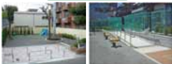
飛び出し防止の柵は幅を持たせて設置