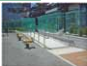
高低差のある入口はスロープを設ける