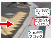
一部に段差をなくしたブロックを設置