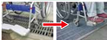
横断側溝（太目）車椅子などが挟まる