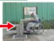
車椅子の方も小さな子どもも利用できる