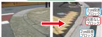
歩道の端を示す2cmの段差が障害に